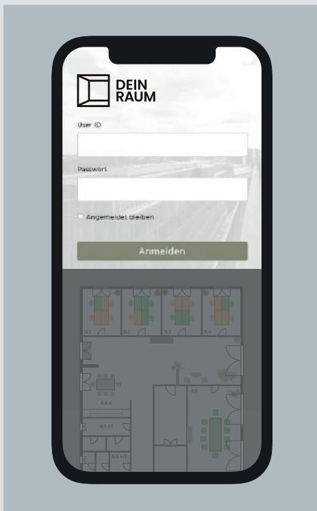
1. DEIN RAUM öffnen & einloggen