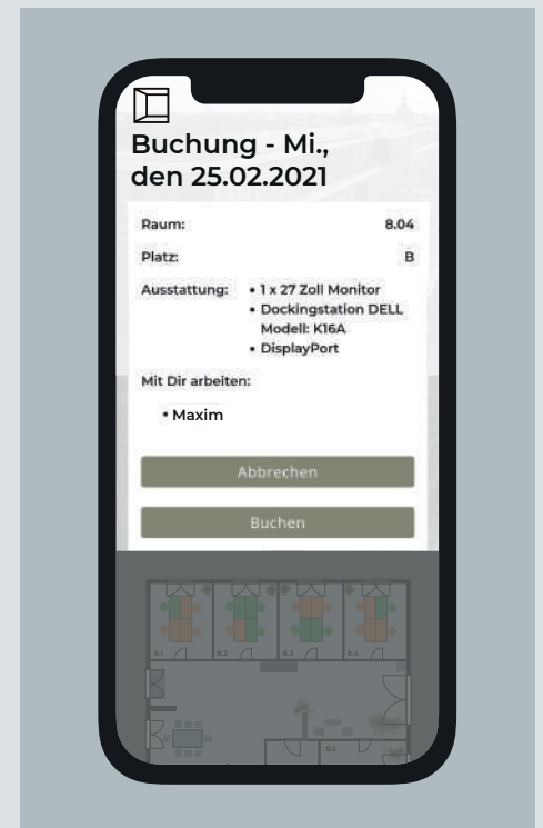
3. Platz buchen